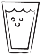
VASO DE AGUA