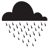
NUBE DE LLUVIA